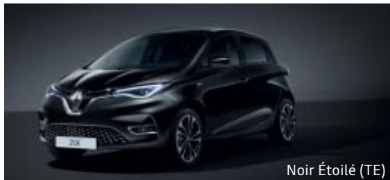
Noir Étoilé (TE)