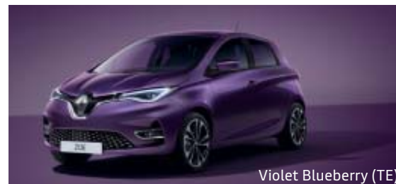
Violet Blueberry (TE)