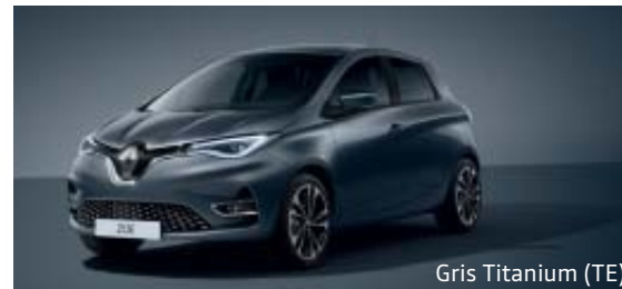
Gris Titanium (TE)