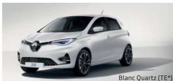
Blanc Quartz (TE*)