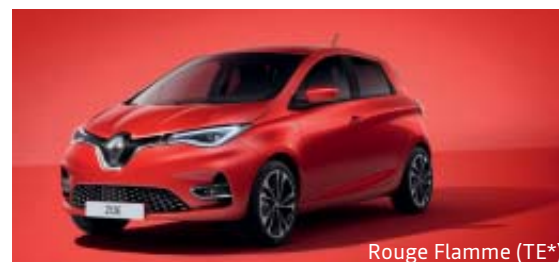
Rouge Flamme (TE*)

OV : opaque verni - TE : peinture métallisée - * Peinture métallisée avec vernis spécial - Photos non contractuelles.