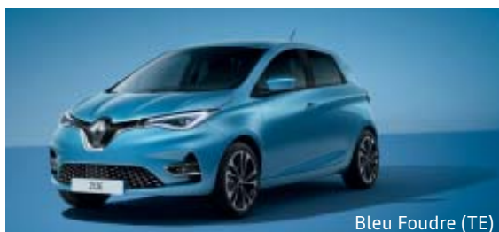
Bleu Foudre (TE)