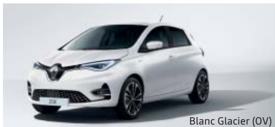
Blanc Glacier (OV)