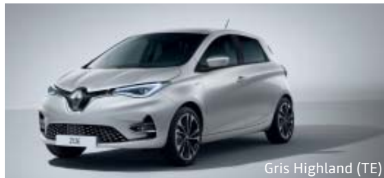
Gris Highland (TE)