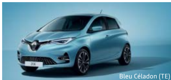
Bleu Céladon (TE)